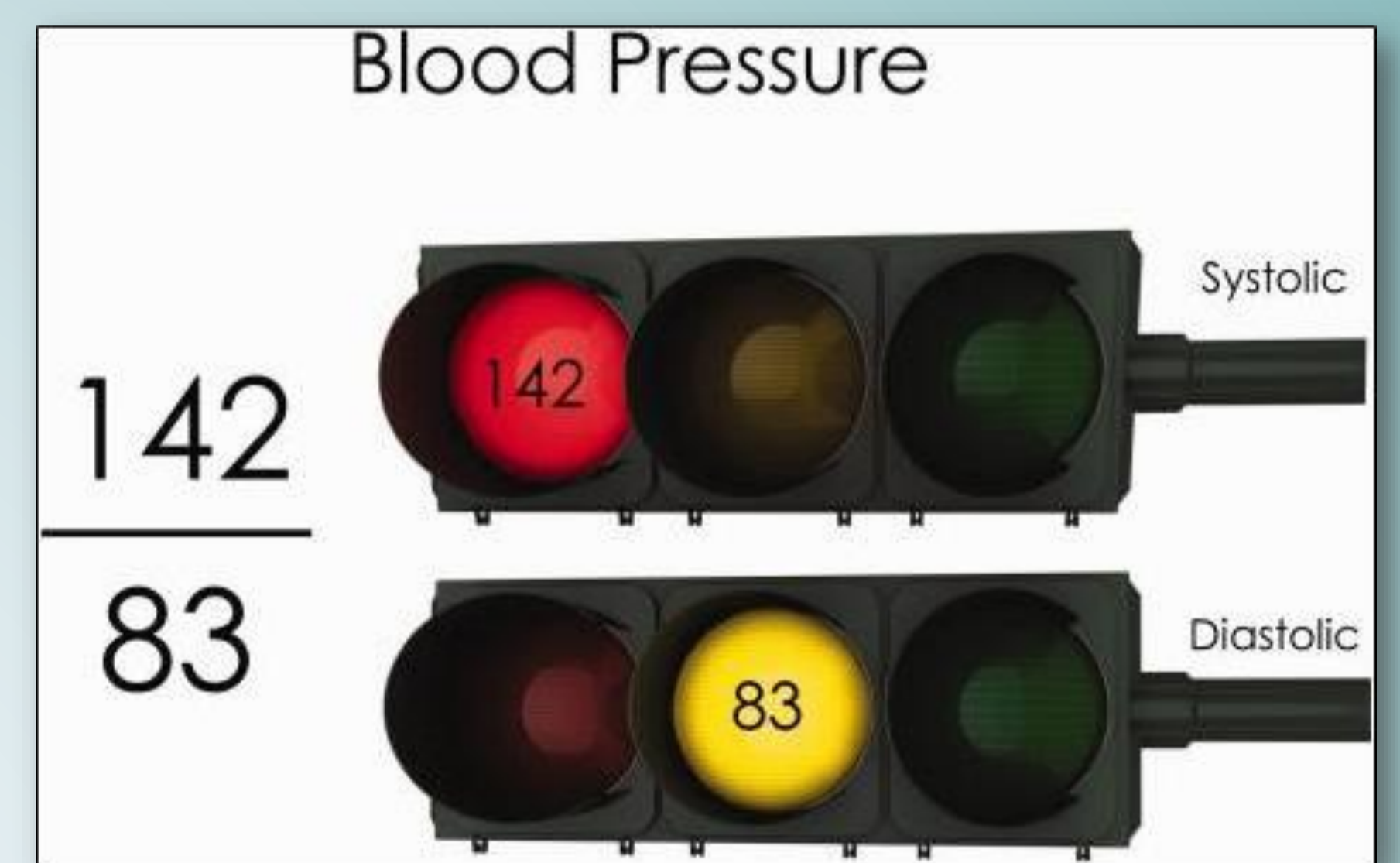
שימוש באמצעי המחשה בקליניקה