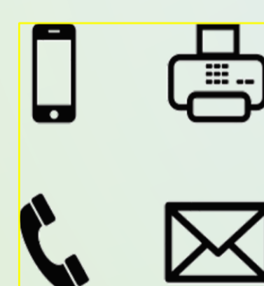
ספר לימוד הכולל פרק בנושא: